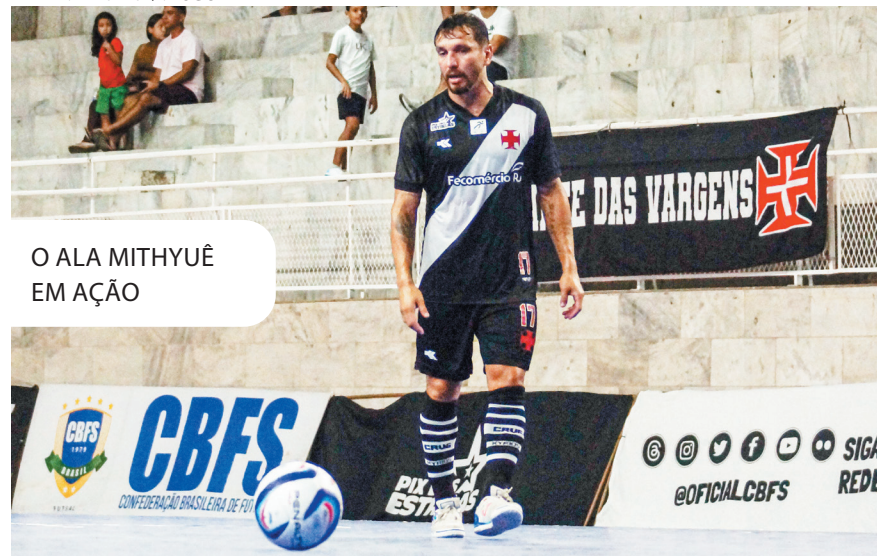
O ALA MITHYUÊ EM AÇÃO

“ Eu quero vivenciar novamente aqueles momentos. Vencemos a Liga Nacional em 2000 com um grupo fantástico. Tudo isso me veio à tona quando cheguei aqui em São Januário, me emocionei.”